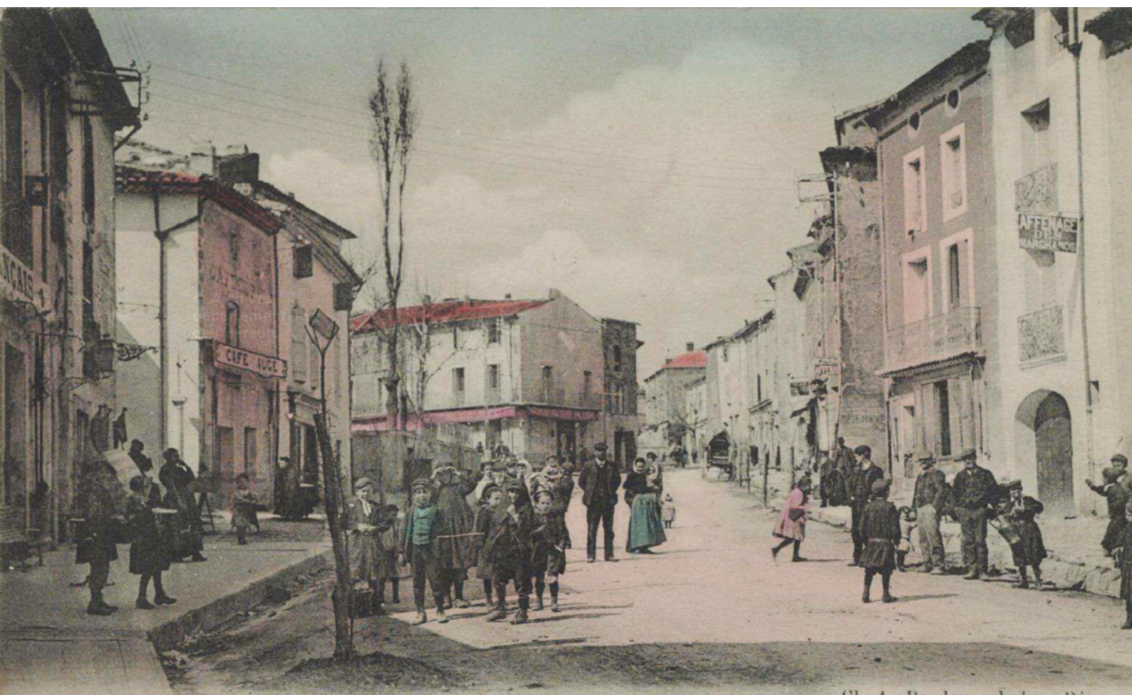
Roujan (Hérault) - Vue du Centre

(Alexandre Bardou, photographe-éditeur, Archives départementales de l'Hérault, 2 Fi CP 168)