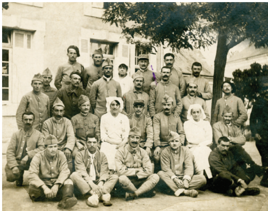
Affecté à l'hôpital militaire de Castres le 29 août 1939 (assis à gauche)

La fin de sa vie fut faite de labeur, de loisirs simples (il était passionné par les courses